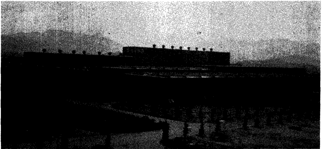
〈曉星重工業(株) 昌原工場全景〉

축적된 技術과 고급인력 그리고 全體적으로 推進하고 있는 品質管理(Total Quality Control)運動을 통하여 諸般管理業務의 改善, 철저한 品質保證, 生産性 向上을 이룩함으로써 이미 '84년도 品質管理大賞을 수상하였고, 이를 바탕으로 한 持續的인 技術開發로 國內 重電機器 業界의 중추적 역할 뿐만아니라 世界的인 重電機器 製造業體로 크게 成長할 것으로 期待된다.