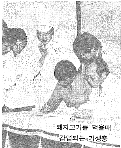
돼지고기를 먹을때 감염되는 기생충

유구조충에 걸리게 되는 것이다. 그러나 유구조충의 알이 사람에게 섭취되면 이 충란이 장내에서 부화하여 사람 몸 안에 서도 낭미충이라고 부르는 유충이 발육 하게 되는 것이다. 이 알이 사람 몸 안 에 들어오게 되는 경로는 1) 자신이 갖 고 있는 성충(유구조충)에서 배출 되는 알이 장내에서 부화하는 경우 2) 자신의 대변에 묻어 나온 알을 다시 자신의 손 에 묻혀 섭취하는 경우 3) 다른 사람이 배출한 알을 음식물등을 통하여 섭취하 는 경우등을 들 수 있다. 일단 사람의 창자 내에서 부화한 알은 장점막 혈관을 통하여 우리 몸의 각 부위로 이동해 1 ~1.5cm정도 크기의 콩알 모양의 낭미 충으로 발육한다. 말하자면 사람은 유구 조충의 종숙주이자 중간숙주인 셈이다.