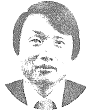
구 장 회

사회보장제도의 일환으로 우리나라에서 처음 실시되는 의료보험 시행 시점인 77년 7월에 발족된 코오롱 의료보험조합은 우리나라 의료보험사의 한 단면이라 할수 있을 것이다. 초기에는 보험재정이 급격히 상승하더니 불과 수년후부터는 적자를 나타내 보험료율을 3%에서 4%로 인상하였으나 이도 위태로운 실정이다. 이만큼 의료 수요가 급팽창하고 있다는 의미도 되겠으나 잘못 인식되어 있기 때문이 아닌가 하고 생각해본다. 먼저 의료보험은 일정한 기준에 의한 보험료를 납부함으로써 기금을 이루고 그 기금으로서 병환이 발생시 재정적으로 도와 주는 역할을 하는 것이다. 그래서 비슷한 집단마다 조합을 구성하여 남또는 나의 불의의 병고에 대한 지원을 하게 되는 것이다.