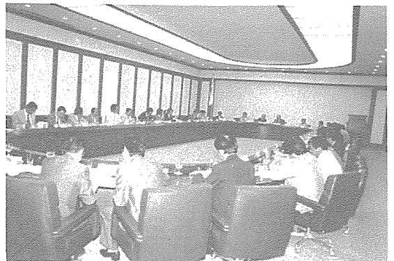
<새로 편성한 예산안 추인은 물론 중앙을 위시한 전국지부의 당면문제가 진지하게 토의되었다>