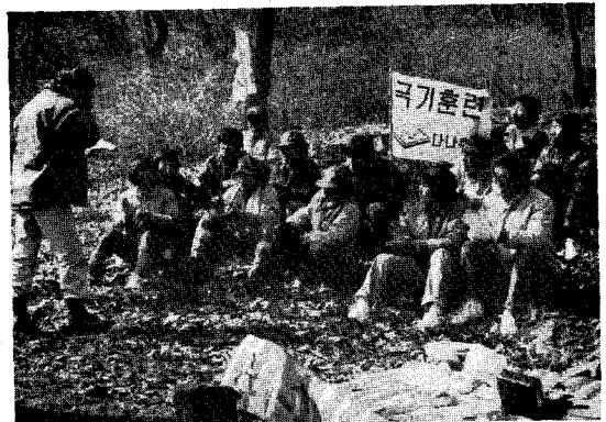
▲ 북한산성정상에 오른 다나가족들

이날 전원 정상에 올라가 몸과 마음을 단련하며, 머리에는 창의, 가슴에는 성실, 얼굴에는 친절로서 축산업계에 봉사할 것을 다짐했다.