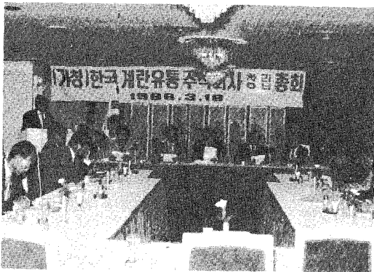
▲ 맘모스호텔 4층회의실에 주주총회 광경

한국계란유통(주) (대표 명제운)은 지난 3월 18일 청량리 맘모스호텔에서 주주 등 30여명이 참석한 가운데 창립총회를 개최했다.