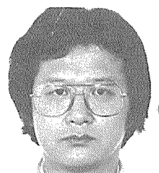
김인철 종합건축사사무소 엄·이건축

아무쪼록 '86년은 회원모두가 주어진 여건하에 최선을 다해 作品에 전념하여 좋은 건축물이 쏟아져 나오길 바란다.