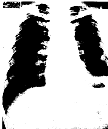
Fig. 2. Chest roentgenogram of a patient with post-operative left hemidiaphragmatic elevation.