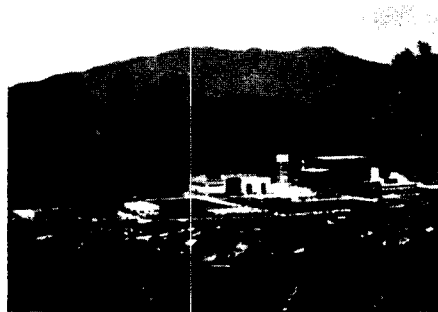
* 전기연구소 전경

시험설비, 전기재료 연구시험설비들을 갖추고 있다. 이 가운데 대전력연구시험설비와 초고압연구시험설비는 국내에서 전기연구소만이 보유하고 있는 현대식 설비로 현재 시가로 치면 건설비를 포함하여 약 5백억원에 달하는 중요한 설비이다.