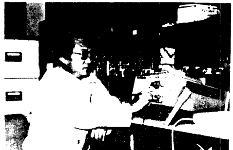
* 고주파 인버터장치