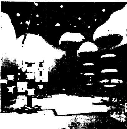
* 고전압 시험설비

전력전자 연구부의 현황과 전망을 살펴보면, 컴퓨터, 통신, 마이크로 프로세서 등 전자기술을 전력계통분야에 응용하여 전력설비 운용효율의 향상, 기기의 다기능화, 공급전력의 질적향상을 기하고, 급속히 발전하는 전자기술을 전력산업에 적용하기 위하여 광·디지털