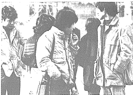
성이 나아가야 할 방향이 모호한 상태에 있는 것이 오늘날의 현황이다.

문제에 있어서도 그들이 멋모르고 덤비고 있다는데서 많은 문제가 생기고 있어 더욱 안스럽고 가슴아픈 일이 아닐 수 없다.