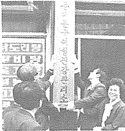
(동대문구 여성건강관리소 현판식 장면)

建協 서울시지부는 지난 4월 16일 88 등 대규모 국제행사에 대비, 효율적인 성병