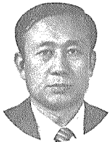
이 관 영

국민의 무병과 건강증진을 목표로 하는 건강관리사업이야말로 그 것이 가지는 의미는 실로 지대하며, 본 사업을 알차게 전개할 수 있도록 모두가 사명 의식을 갖는 것 또한 중요한 일이라 하겠습니다