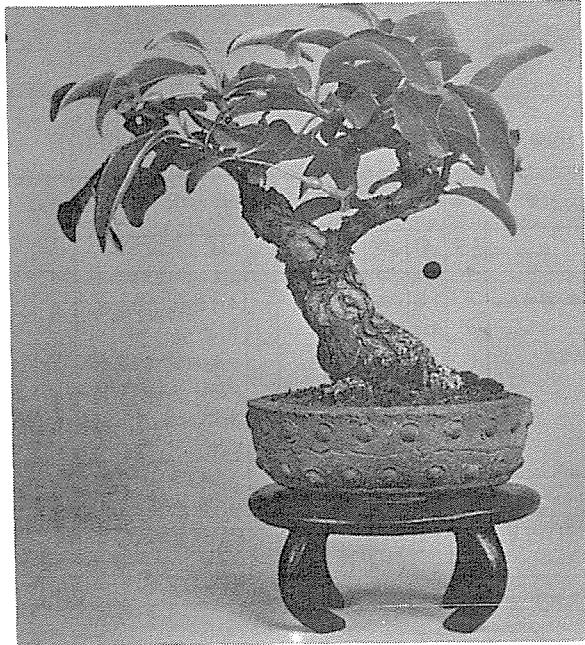
-보리수나무과- 學名 : Elaeagnus umbellata

평안남도 이남에서 자라는 낙엽관목(落葉灌木)으로써 나무 높이가 3~4m 까지 자란다.