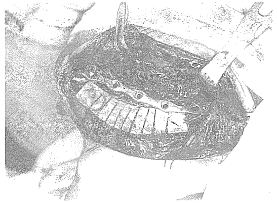
그림 3. 하악골에 악성종양이 발생한 환자에 대해 하악골 부분 절제술을 시행후 금속판을 잔존골의 양측에 고정하고 장골을 적당한 형태로 구부린 모습.

구강 및 악안면 조직에 악성 종양이나 양성 종양, 또는 기타 원인으로 인해 수술을 시행할 경우 조직 결손이 발생할 수 있는데, 이때 환자는 질병이 완치된다 해도 안모의 심한 변형 및 기능 장애를 초래하여 정상적인 사회 생활에 어려움을 겪을 수 있다. 이러한 환자를 정상적 사회 구성원으로 환원시키기 위해 여러 가지 방법의 악안면 재건술이 이용되고 있는데, 금번 호에서는 하악골 절제술을 받은 환자에게 금속판 및 자가 장골(腸骨)을 이용해 결손부를 수복하는 술식을 소개하고자 한다.