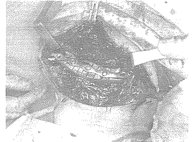
그림 4. 장골과 금속판이 나사(screw)에 의해 고정이 끝난 모습.