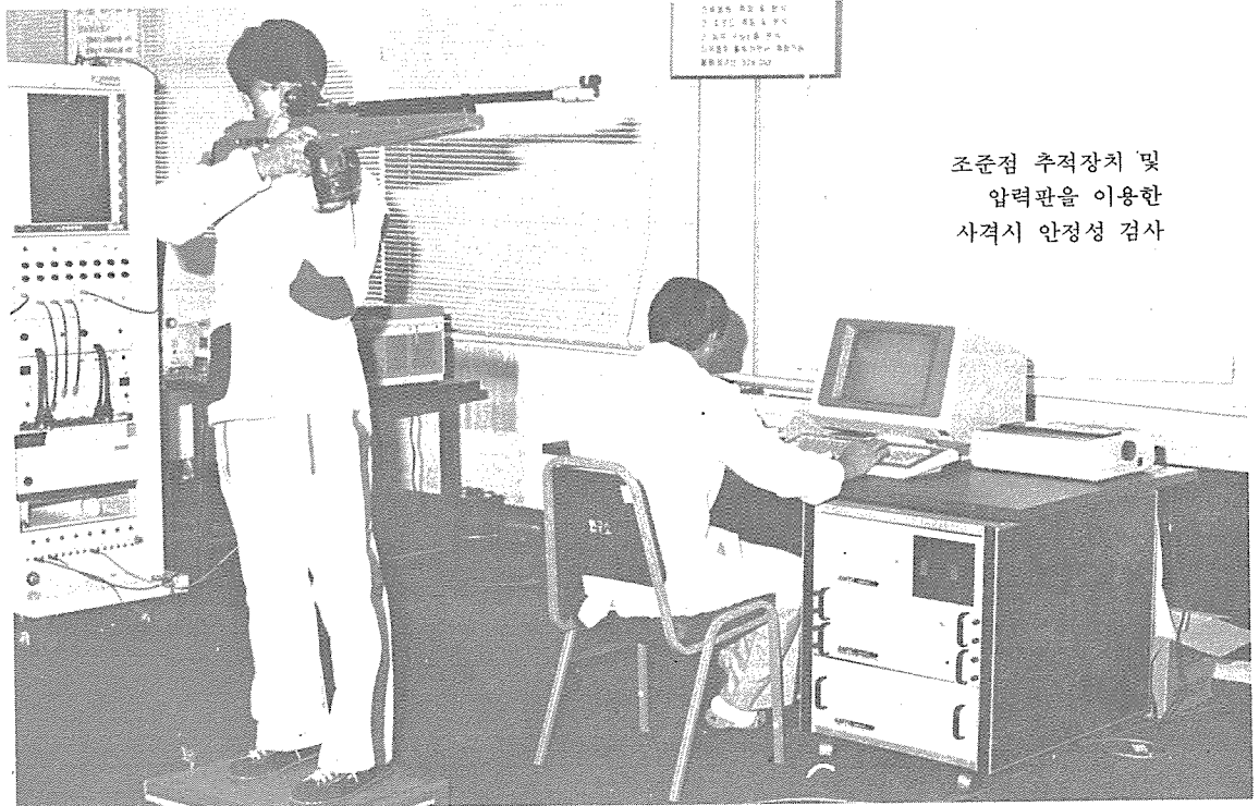
조준점 추적장치 및 압력관을 이용한 사격시 안정성 검사

양궁과 사격은 개인별 체력과 기술을 토대로 경기시에 적절한 정서상태가 유지되어야 최대의 성과를 얻을 수 있다. 이러한 사항에 착안하여 스포츠심리·사회학연구실에서는 스포츠경쟁불안검사(SCAT)와 초조반응검사를 위해 자체 개발하여 활용하고 있는 불안원인조사 설문지 등을 이용하여 선수들의 경기불안수준 및 원인을 파악함으로써 선수개인별 최적의 컨디션을 유지