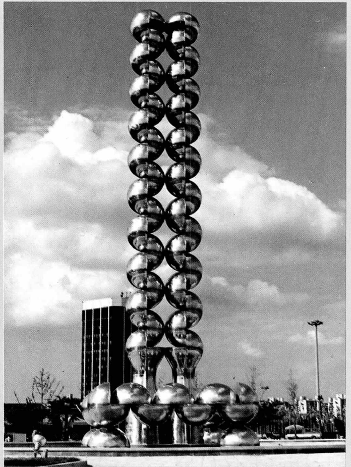
▶ 올림픽 화합 □ 문신 □ 금성전선 중기부 시공