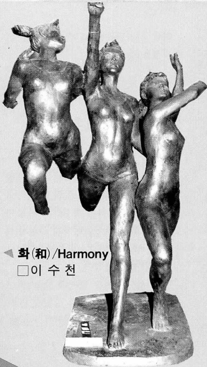
◀ 화(和)/Harmony □이 수 천

우리 고유의 전통과 정신문화를 세계에 알린 복식 2,000년전과, 올림픽의 영원한 세계평화 정신을 기리는 평화의 문, 그리고 지구촌 각국이 참여한 야외 조각공원을 둘러 보았다. <편집자 註>