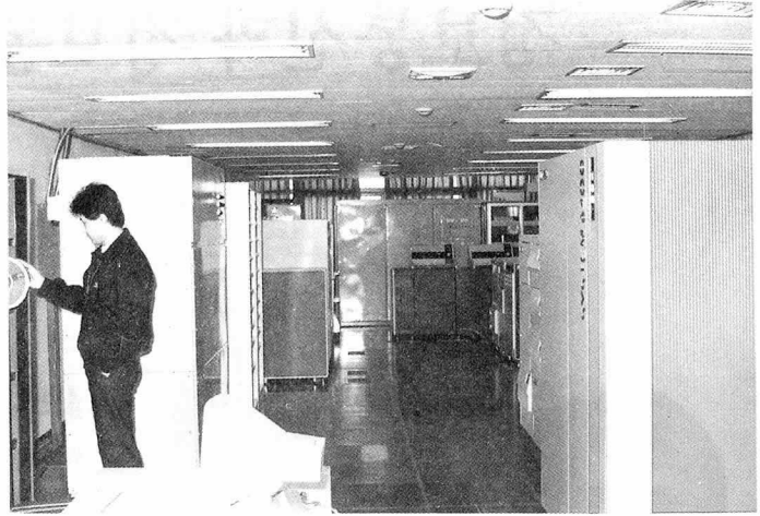
▲주전산기 엘엑시 6400을 주축으로 한 전산실

경설비, 공공시설 등과 대우그룹 계열 사업무를 지원하는 정도로 여겨왔으나 외부요청에 따라 외주에 응하게 되었고, 이후 사업범위를 넓혀 과학·기술계산 및 CAD분야로부터 일반관리업무와 산업시설 자동화부문의 소프트웨어 개발, 하드웨어 판매까지 확대하게 되었다.