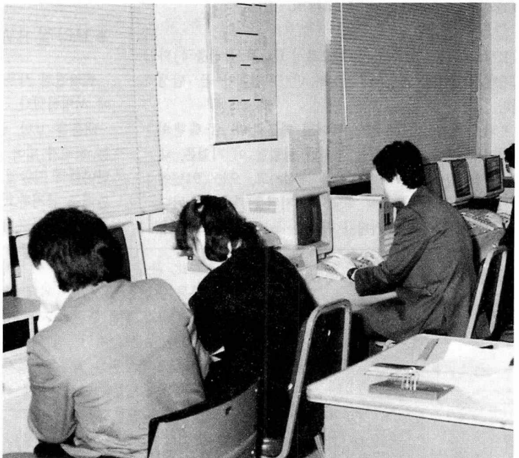
▲원벽한 프로그램을 탄생시키기 위해 작업에 열중하고있는 프로그래머들.