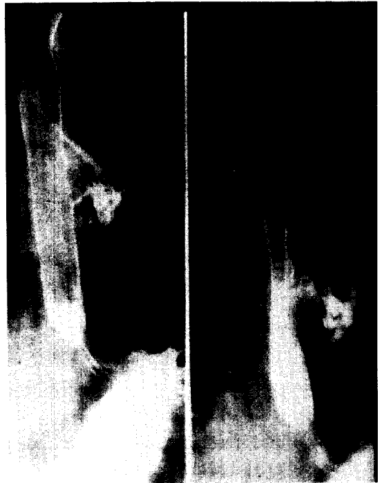
Fig. 2. Pre-operative esophagogram.

발생빈도는 선천성 식도-기관루의 약 반 정도의 발생빈도로 나타나며 2) , 남녀간에는 큰 차이는 없다고 한다 6) . 식도-기관지루의 위치는 Kurushige등의 보고에 의하면 좌측 기관지와와의 교통이 11명 우측 기관지와와의 교통이 66명 이었고, Braimbridge등의 보고에 의하면 우측이 60%로, 우측에 많은 것으로 되어 있다 3) .