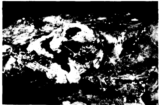
Fig. 5. Specimen shows fistula tract, that communicate with left lower lobe superior segmental bronchus.