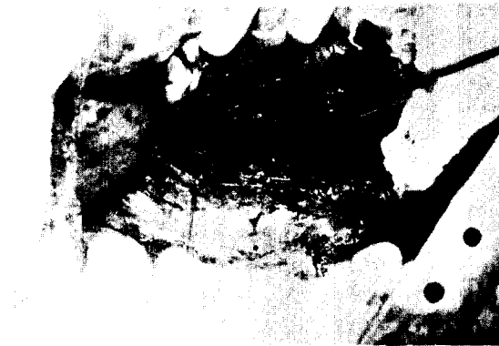
Fig. 4. Intra-operative view shows esophageal diverticulum.

담, 만성적 해소, 반복되는 폐염, 객혈, 흉통, 간헐적 발열등 주로 호흡기 증세를 보이고, 물을 마시면 발작성 기침 후에 폐에서 수포음이 나타나는 Ono's sign이 특징적으로 나타나기도 한다 13) . 증상의 발현은 보통 늦게 나타나서 진단시 평균연령이 33세이고 증상의 지속기간이 6개월에서 50년까지로 다양하며 평균 17년 정도로 보고하고 있다 5) . 이와 같이 증상이 늦게 나타나는 원인으로는 3, 5, 7, 12) , 초기에 누공에 얇은 막이 있다가 파열되어, 식도 점막의 주름이 초기에 누공의 입구를 덮고 있다가 그 역할이 이루어져, 누공의 식도 개구부가 기관지 개구부보다 낮으므로, 누공의 완곡한 통로와 연해서 식도 근육의 수축에 의해, 경미한 호흡기 증상이 지속되므로 적응되어, 누공에 팔약근이 존재하기 때문 7) 이라는 등의 여러 설이 있으나, 어