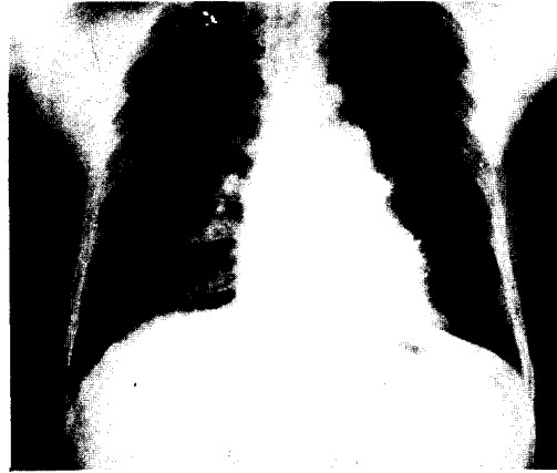
Fig. 1. Pre-operative chest X-ray.

발생기전에 대하여는 여러 가설이 있으나 발생학적 원인이 가장 신빙성있게 받아들여지고 있다 2,4,5) . 즉 기관이 자라 나오면서 식도와 분리되는 과정에서 tracheobronchial tree와 식도의 접촉관계가 지속되어 발생하며 2) , 기관지 내의 누공의 위치는 식도 기관지 분리당시 기관의 성숙 정도와 관계되어 기관이 빨리 성숙 되었을 경우 누공은 기관지의 아래쪽에 위치하게 되며, 기관의 성숙이 늦은 경우에는 누공은 기관지의 윗쪽에 위치하게 되는 것으로 받아들여지고 있다.