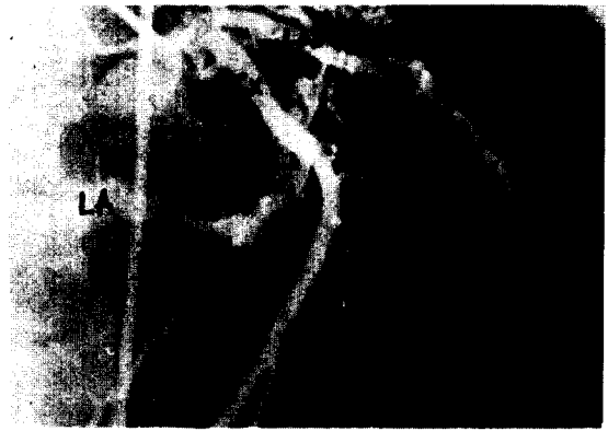
Fig. 2. Lt coronary angiogram shows coronary AV fistula between Lt CX artery and LA auricle(arrow). LAD: Left anterior descending artery. CX: circumflex artery. LA: left atrium