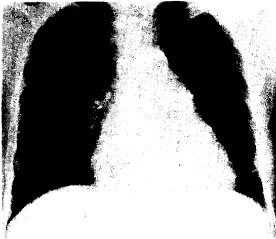
Fig. 3. Postop Chest PA shows less prominent pulmonary conus & decreased pulmonary vascularity.

근처의 폐정맥과의 직접적인 통로를 가지고 있는 경우로 정의되며 선천성 관상동맥질환 중 가장 많은 비율을 차지한다 1) .