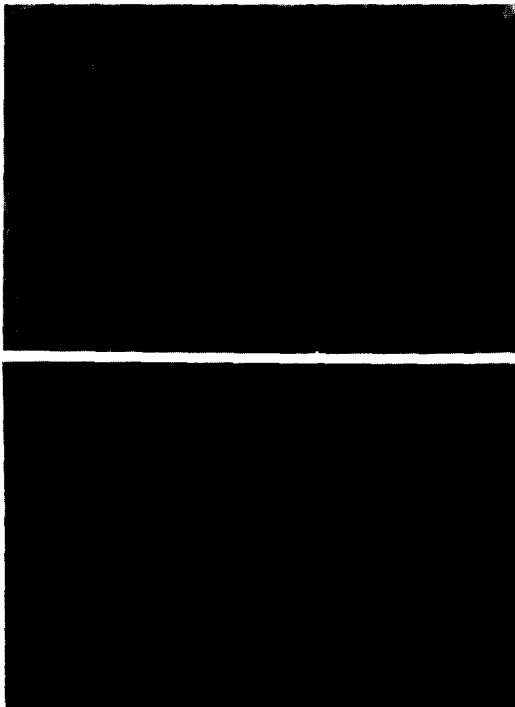
Fig. 2. Photomicrographics in 75 : 25 blend of corn germ oil and fully hydrogenated soybean oil before(up-per) and after(below) interesterification

CGO와 FHSO를 혼합한 것과 이들을 에스테르 교환한 것의 지방산 조성의 변화를 분석한 결과는 Table 3과 같다. 즉, CGO와 FHSO 혼합유의 지방산 조성은 에스테르 교환에 의해 변화되지 않았다. 이와 같은 결과는 에스테르 교환에 의해 triglyceride 중의 지방산들이 화학적 수식을 받지 않고 결합위치만 바뀌어 재배열된다는 사실 (9) 을 입증하는 것이며, 和田과 小泉 (24) 그리고 Chacon과 Handel (12) 도 동일한 결과를 보고하였다.