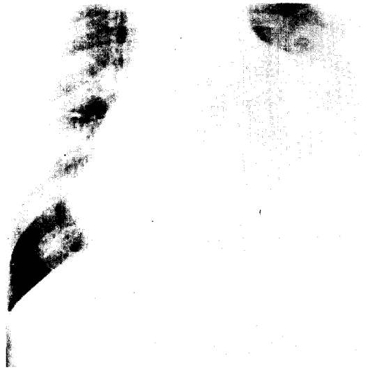
Fig. 1. 술전 흉부X-선 소견으로 심장이 심하게 커져 있고 심장흉경비율(CTR)이 0.73이었다.

단순흉부 X-선 소견에서 술전에는 심장흉경비율(cardio-thoracic ratio)의 평균이 0.73이었고 술후에