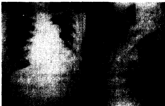
Fig. 1. Preop chest PA and lateral view showing egg-shell shaped calcification.

左心室 機能은 低下되어 있었으며 grade II / IV 정도의 僧帽瓣 閉鎖不全을 보였다. 手術은 4번째 左側