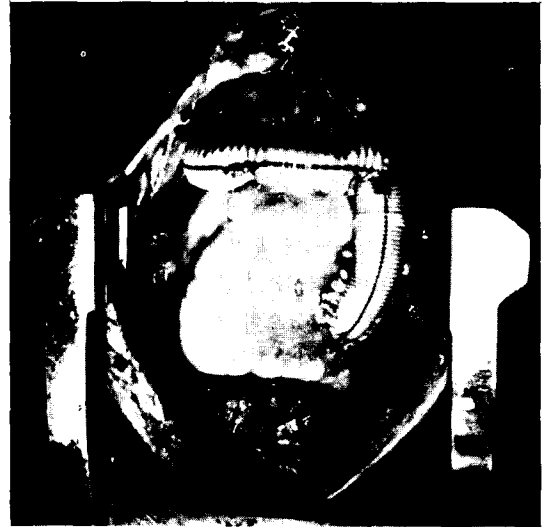
사진 4. Anastomosis from right ventricle to graft used with external Björk shiley valved conduit.

합부위에 출혈이 있어서 좌흉강을 전측부에서 개흉하고 지혈하였다(사진 4).