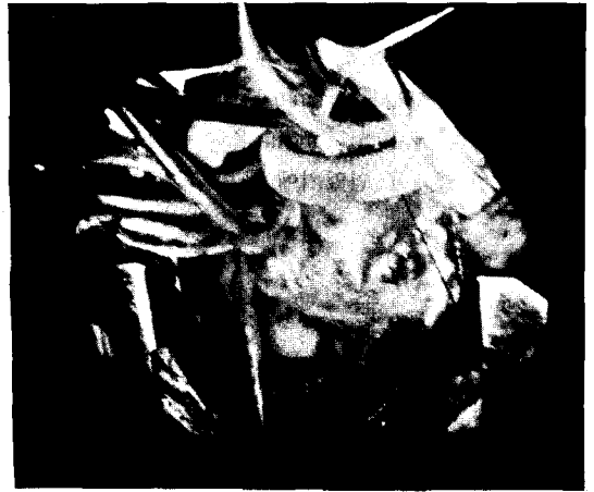
사진 3. Anastomosis to right and left pulmonary artery with straight Dacron graft

동시에 폐 생검을 좌측폐상엽에서 시행하여 병리검사상 폐 실질의 이상 소견이 없음을 확인하였고, 1주일 후에 2차 수술을 시행하였다. 2차 수술은 흉골 정중 절개로 개흉하여 상행대동맥과 우심방을 통하여 상공정맥과 하공정맥에 도관을 삽관하고 체외순환을 시작하면서 끈 동맥관을 절찰하였다. 좌측 흉강을 열고서 좌 폐동맥을 노출하고 심낭을 절개한 부위를 통하여 우 폐동맥과 주 폐동맥을 확인하였고 16mm albumin coated woven-dacron graft을 이용하여 prolene 6-0로 좌·우 폐동맥 측면과 graft의 말단을 심장이 박동하고 있는 상태에서 문합 하였다. 문합술은 graft가 상행대동맥의 전부로 지나가게 하였고(사진 3), 이때 대동맥은 개통한 상태에서 30℃로 체온을 유지하고 중등도의 저체온 체외순환하에 심박동이 유지된 상태에서 graft와 20mm Björk-Shiley valved conduit의 원위부 문합까지 시행하였다. 그 후 체온을 25℃까지 더 하강시키고 대동맥을 차단하여 cardioplegia를 주입하고 심정지 상태에서 우심실을 종절개하여서 4×4cm크기의 subarterial 및 perimembranous type의 심실종격결손을 double velour 이용하여 폐쇄하였다. 우심실과 근위부 심외 valved conduit를 prolene 4-0로 문합하고 심장내 수술을 끝냈으며 체외순환에서 무난히 이탈할 수 있었다. 그러나 좌 폐동맥과 graft의 문