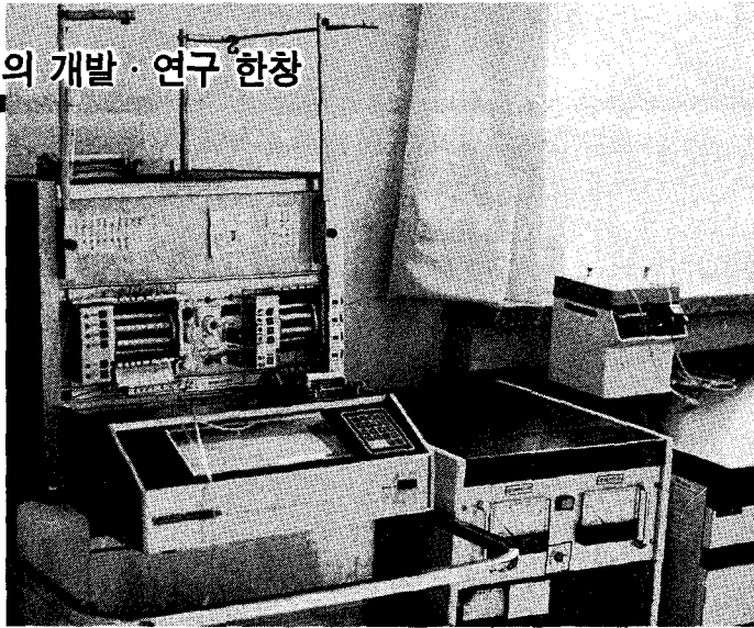
전남대병원 소유, 폐쇄루프형 인공췌장기의 일종인 Biostator

치에 비해 높은 경우에 인슐린이 주입되는 방식이며, 동적인 방법이란 비록 혈당이 높다 할지라도 어떤 시점에서 떨어지고 있는 상태라면 인슐린주입이 감소되고 반대로 정상혈당이라도 어떤 시점에서 올라가고 있는 상태이면 인슐린 주입이 증가되는 즉, 혈당의 변화율에 따라 인슐린주입이 결정되는 방법이다.