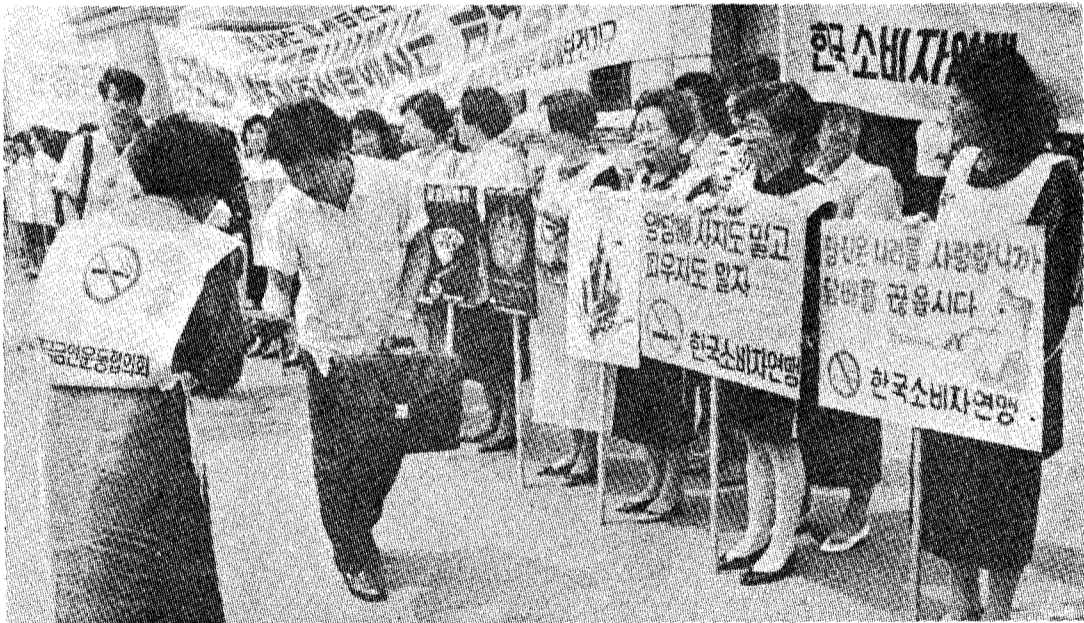
식도암의 정확한 발생원인은 알 수 없으나 역학적인 조사로는 지나친 음주와 흡연이 강력한 원인으로 제기되고 있다. (사진은 本文특정기사와 관련없음)