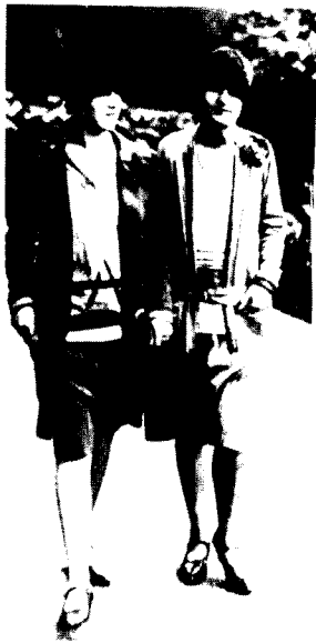
[그림 7] garçonne style.