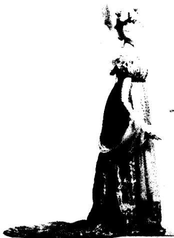
[그림 1] empire Style.

왕정복고시대의 복식[그림 2]은 과장된 소매(bertha collar와 연결되는 puff소매, balloon gigot소매, imbecile소매, engageantes)와 가느다란 허리의 강조, 또 크리놀린의 조짐이 보이는 퍼진 스커트 등 실루엣 자체가 과장