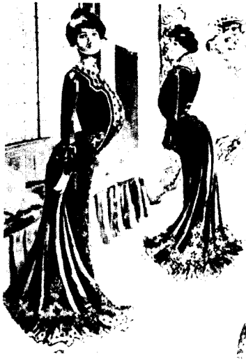
[그림 6] s-curved silhouette.