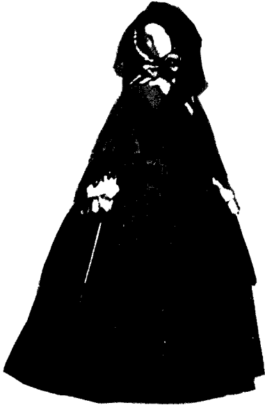
[그림 3] Crinoline style.