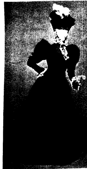
[그림 5] hourglass silhouette.

아우어글래스(hourglass)실루엣의 복식 28 [그림 5]은 레그오브머튼(lef-of-mutton)소매와 퍼프소매를 사용하여 넓은 어깨를 강조하고 허리를 가늘게 하였고 하체부분은 고어드스커트를 사용하여 신체를 따라 나타나는 선을 약간 과장시켜 표현하였으며, 이를 위해 옷의 재단방법에서부터 이 목적을 고려한 여러 장식이 보인다. 이것은 왕정복고시대에서 보여진 장식유형처럼 소매자체를 이용한 장식이 거의 대부분을 차지하고 있다