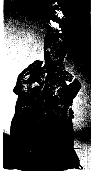
[그림 4] bustle style.

되기 시작하고 있다 20,22,23 ). 그런데 이때 사용된 장식은 트리밍의 개념보다는 소매자체를 확대시켜 장식의 효과를 갖는 구성상의 장식방법을 사용하고 있다(유기적 장식).