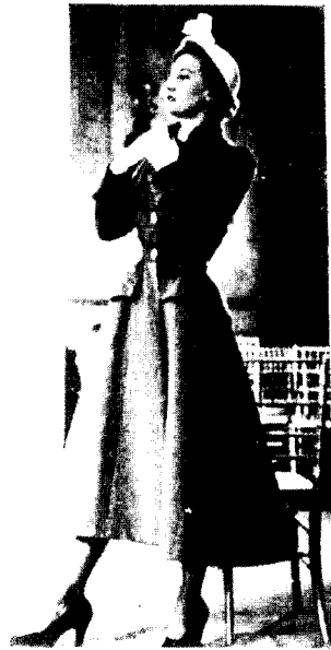
[그림 8] New-Look.

유기적 장식). 실루엣과 장식유형과의 관계의 변화를 좀 더 명확히 보기 위하여 20세기초의 복식을 몇가지 더 예를 들어보기로 한다.