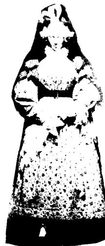
[그림 2] 왕정복고 시대.