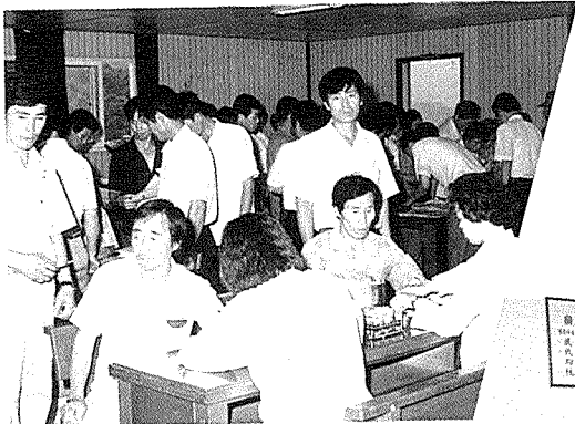
▲ 피보험자·피부양자에 대한 간염검사, 성인병 검사