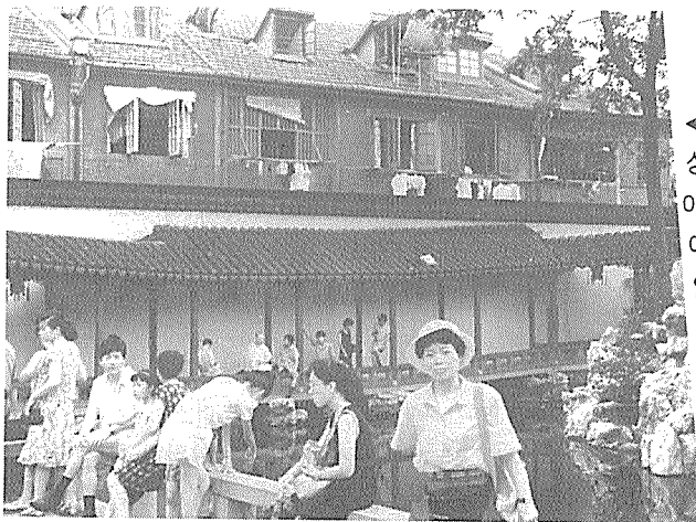
◀ 예원(藝園).예원은 상해시에 있는 유일한 정원이다. 관광객들로 붐비는 예원의 담장 너머로 창문을 열어 놓은채 빨래를 말리고 있는 중국인들의 살림집이 함께 보인다.

그런데 바로 그 일대회지 건물의 골목 어귀에서 앞서 말한 젊은 남자를 마주친