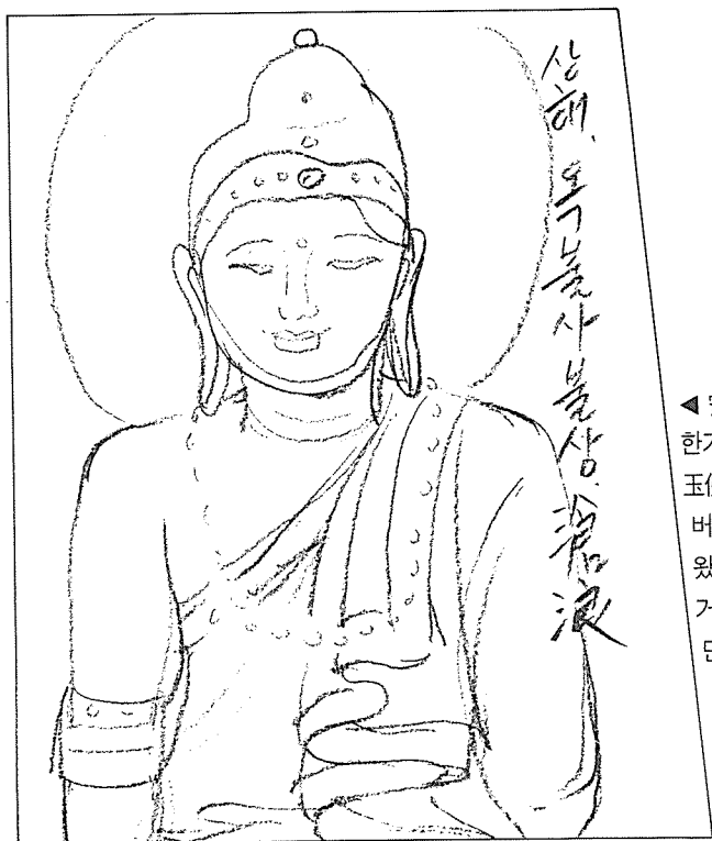
◀ 安遠路 10號 상해시내 한가운데 자리잡고 있는 玉佛寺의 불상(부분). 버어마로부터 운반되어 왔다는 이 옥불좌상은 거대한 옥돌하나를 깎아서 만든 것으로 유명하다.