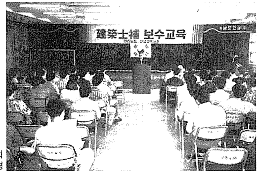
전남건축사회 건축사보 보수교육 광경