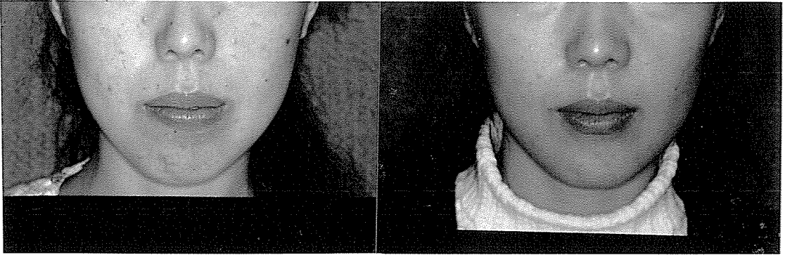
그림 2. 얼굴의 옆모습이 ① convex하고 ② 아래턱의 무턱과 같은 양상이고 ③ 입술의 불완전폐쇄가 있는 Long Face syndrome이 턱교정수술후 ① 정상적인 얼굴 옆모습이 되고 ② 아래턱이 auto-rotation으로 정상으로 되었으며 ③입술이 자연스럽게 폐쇄될 수 있었다.