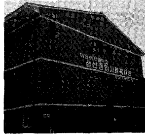
이대 성산 사회복지회관 전경

다만 의료법령에 의하여 국가의 보호를 받고있는 경우(결핵예방법, 전염병 예방법, 산업재해보상보험법, 모자보건법)와 특수한 재료를 요하는 경우(보조기, 의수족, 의안, 보청기 등) 그리고 특진, 진단서 발급등은 의료보호