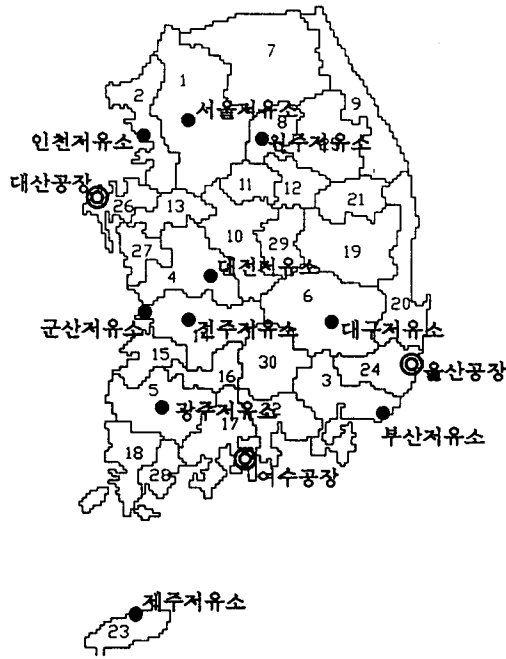
〈그림 2〉 수요존의 구분