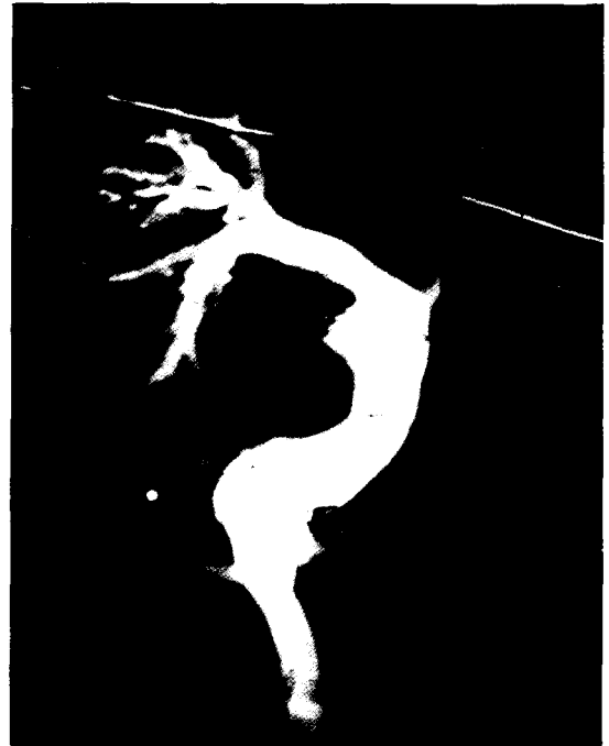
그림 2. 수술 2개월에 시행한 DSA(Digital Subtraction Angiography) 소견. 하공정맥으로부터 우폐동맥으로의 혈류가 잘 유지되어 있다. 좌폐동맥이 조영되지 않은 것은 상공정맥으로부터의 혈류로 인해 조영제가 희석되었기 때문이라 생각된다.

먼저 하공정맥 혹은 간정맥이 심방으로 유입되는 부분을 그 원주의 1/2정도 절개하고 심방쪽은 후면에 부착하였다. 다시 좌측 심방이의 심외막을 폐동맥 절개부위의 후면 1/2에 접합하여 심장의 측로관의 후면을 심외막으로 형성하였다. 이후 도관의 앞면은 증례 1의 경우 0.05 M