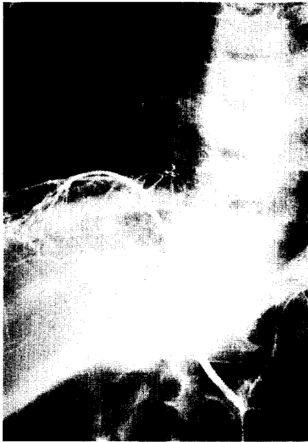
그림 1. 대동맥의 우하 횡격막 동맥과 기관지 동맥에서 혈액공급을 받고 있음.