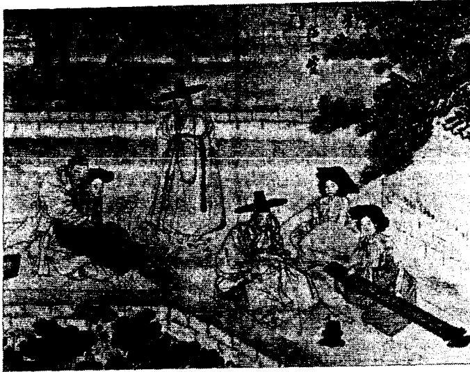
<그림 7> 聽琴賞蓮(간송미술관 소장)