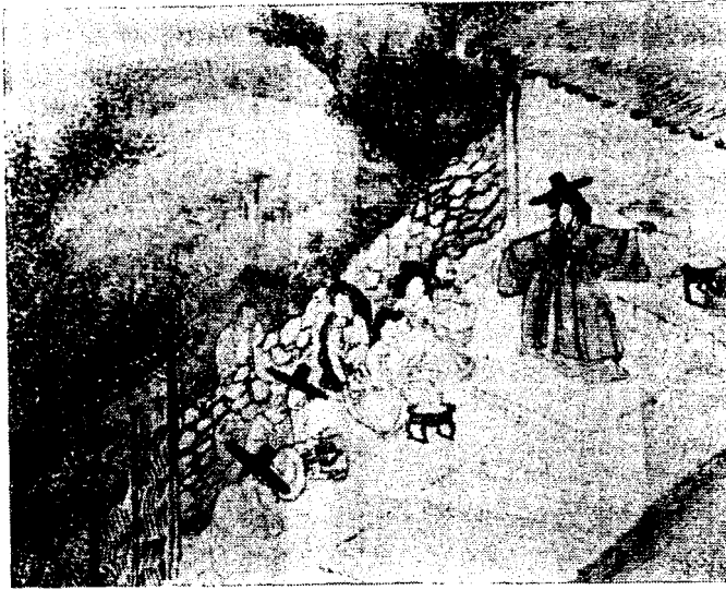
<그림 11> 巫女神舞(간송미술관 소장)

朝鮮時代에는 儒敎的 倫理思想과 男尊女卑 思想이 바탕이 된 억압된 사회였다. 성애의 상징(erotic symbolism)은 억압된 사회에서 더 많이 나타난다. 왜냐하면, 억압된 사회에서는 에로틱한 복식을 직접적으로 착용할 수 없기 때문에 상징이라는 간접적인 수단을 이용하여 에로티시즘을 표현한다. 미묘한 암시에 의해 만족시키는 성애의 상징은 상징을 해석하기 위하여 상상을 즐기기 때문에 실제보다 더 즐겁게 한다.