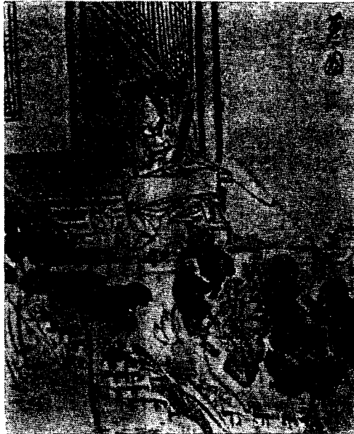
<그림 9> 蓮塘의 女人(간송미술관 소장)

남성의 경우, 笠으로 계급을 구분하였는데, 상류계급의 사람은 <그림 7>과 <그림 8>에서 보이는 것과 같이 넓은 양태와 높은 帽高의 黑笠을 착용하였으며, <그림 7>의 가운데 사람에서 볼 수 있듯이 금패로 보이는 화려한 갓끈을 袍의 앞자락 무릎 가까이까지 늘어뜨렸다.