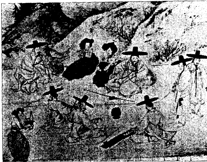
<그림 8> 常春夜興(간송미술관 소장)

아 입지 못하였고, 옷색도 단조롭다. 대부분이 흰색 민저고리를 입었다. 치마에서도 계급구분을 하였는데, 상류계급의 치마는 하층 계급의 치마보다 길이가 길고, 폭이 넓으며 치마색은 주로 남색이다.