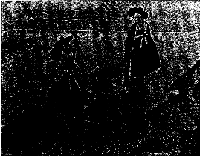
<그림 4> 月夜密會(간송미술관 소장)

조선시대는 엄격한 계급사회였다. 그래서 이러한 계급 구분을 복식에 의하여 대부분 나타