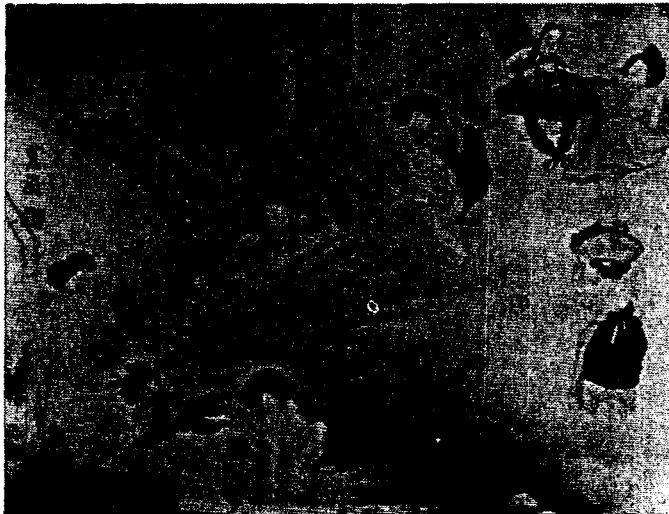
<그림 5> 端午風情(간송미술관 소장)