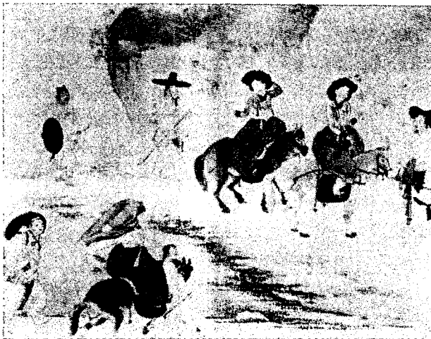
<그림 6> 年小踏街(간송미술관 소장)

<그림 9>의 여인이 착용한 것과 같은 庶民의 저고리는 양반 것과 모양은 같으나 회장을 달