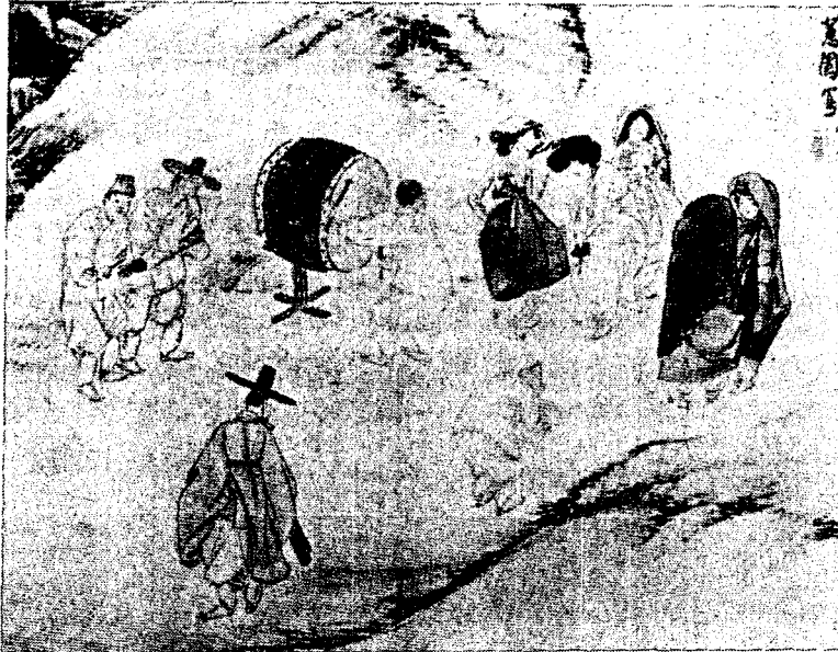
<그림 10> 路上托鉢(간송미술관 소장)

양반 계급의 신은 흰 솜버선을 발등 도둑히 신고 太史鞋와 黑鞋을 신었다. 태사혜는 울을 형겅이나 가죽으로 하고 꼬와 뒤축에 흰 線紋을 새기어 놓았다.