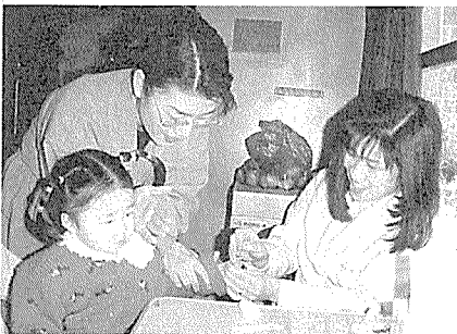
한국건강관리협회 경기도지부는 지난

2월 21일부터 3월 31일까지 수원시민 무료 혈액형 및 당뇨 검사를 실시했다. 당뇨병의 유무와 자신의 혈액형을 미리 알아 둬으로써 자신의 건강관리 및 위급상황 발생시의 응급처치를 위해 실시된 이번 무료검사는 수원시내 각 APT 단지를 순회하면서 검사를 하였으며, 수원시민 1,500여명이 검사를 받았다.