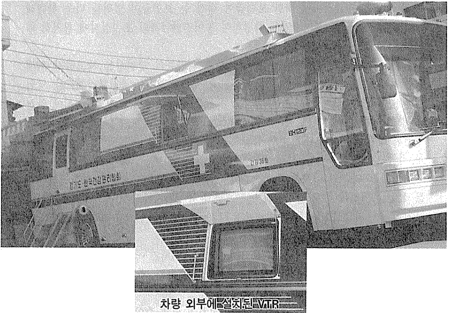
차량 외부에 설치된 VTR

요즘처럼 바쁘게 돌아가는 사회에서는 건강관리를 위해 무언가를 한다는 것, 특히 바쁜 시간을 쪼개 내지 않으면 안되는 종합건강검사를 받는다는 것은 쉬운 일이 아니다.