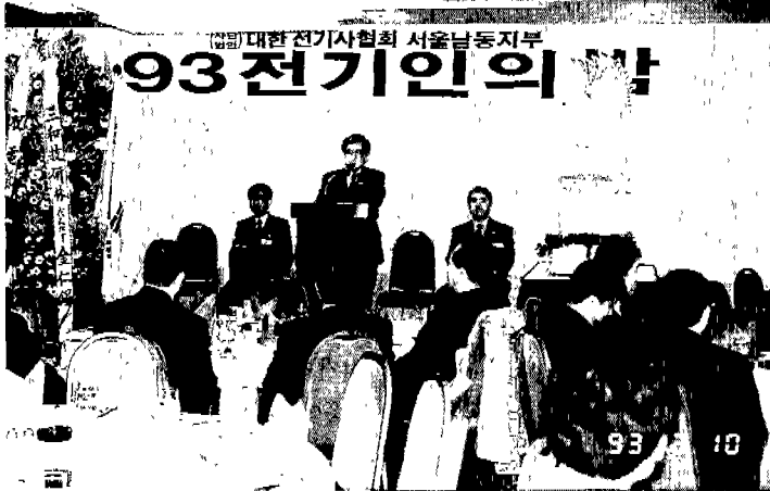
◀ 서울남동지부 '93전기인의 밤