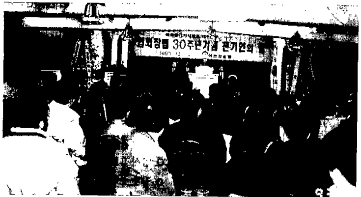
▲ 대구지부 전기인의 밤

강습회 종료후에는 해진뷔페에서 회원상호간의 안녕과 친목을 도모하는 송년 전기인의 밤 행사가 계속되었고, 이번 행사에도 현장기업사, 형제전기에서 많은 협찬과 성원을 보내주었다.