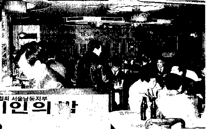
서울남서지부 '93전기인의 밤 ▶