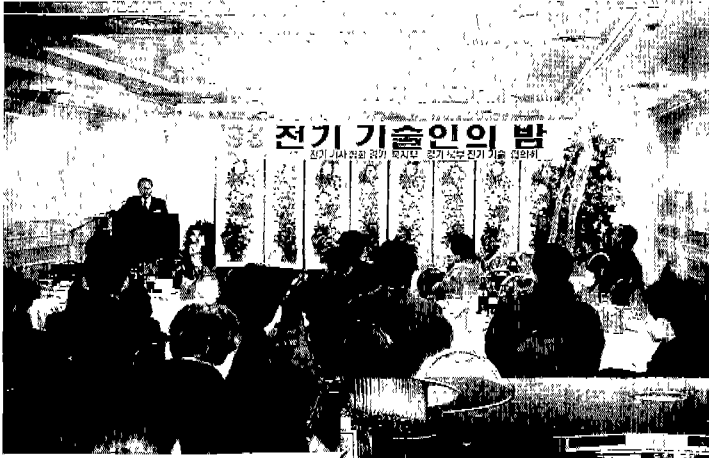
◀ 경기북지부 전기기술인의 밤