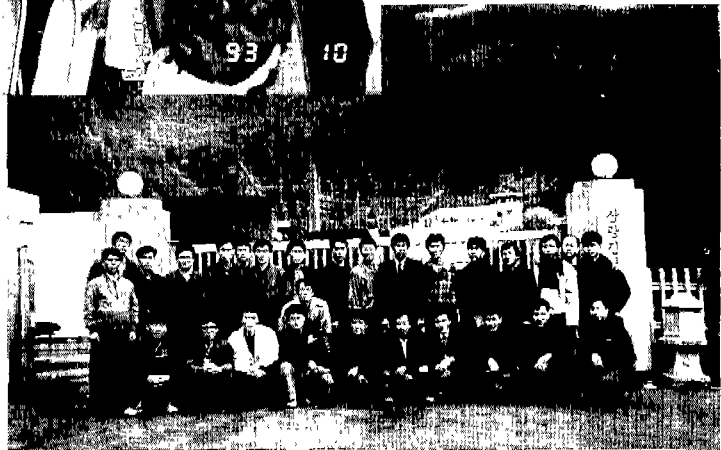
경북동지부 산업체견학 ▶