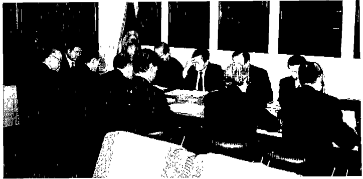
▲ 제20차 이사회

통해 「새로운 마음가짐으로 새로운 협회를 만드는 데 앞장 서자」고 당부했다.