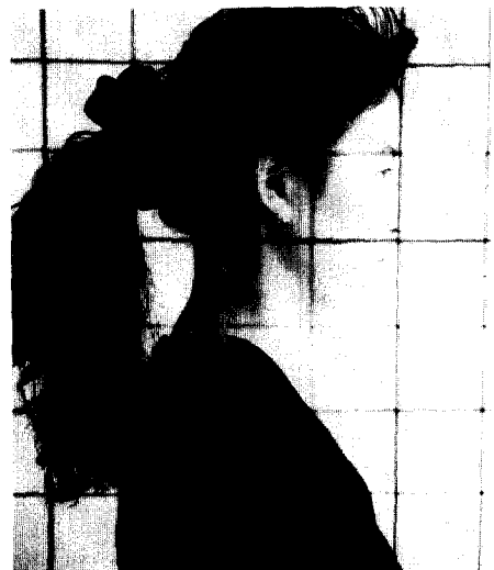
Figure 2. Sagittal posture on vertical plate. Plumb line was marked red.