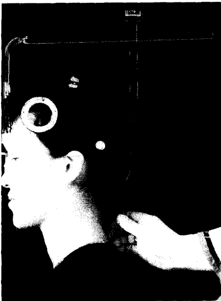
Figure 1. CROM(Cervical-Range-of-Motion) instrument with forward head arm and vertebra locator. Forward head arm is calibrated in centimeters for the horizontal distance from the nose bridge to the point crossed with vertebra locator.

1) Cervical-Range-of-Motion(CROM)의 이용 대상자를 의자에 편안하게 앉힌 후 자연스럽게 전방을 주시하게 하고 두경부자세 및 경부운동을 측정하는 기구인 CROM(Performance Attainment Associates, U.S.A.)을 두부에 장착하였다. 지시서 44) 에 따라 두부전방안정자세(forward head resting posture, FHRP)를 취하게 한 후 미간으로부터 제 7경추까지의 수평거리를 측정하였다. 이때 경추의 굴곡 및 신전을 허용하지 않도록 경추안정자세(cervical resting posture)를 측정하는 각도계의 눈금을 영점으로 맞추어 두부의 후방회전을 억제시킨 후 측정하였다(Figure 1).