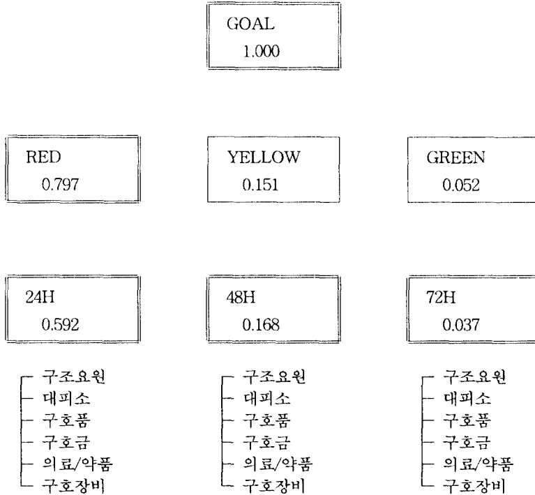
<그림 3> AHP MODEL