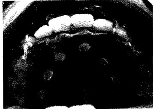
그림 1. 원형 상아질 충전재 및 충전물이 식립된 plate 장착도

블루 색소측정에 적절한 파장을 결정하였으며 이후 희석된 기준용액(standard solution)을 이용하여 흡광도와 색소농도와의 Linear Regression Curve를 얻었다(표 2, 그림 2). 5배 희석된 실험시료의 흡광도를 측정하여 다음 상