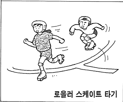
로올러 스케이트 타기