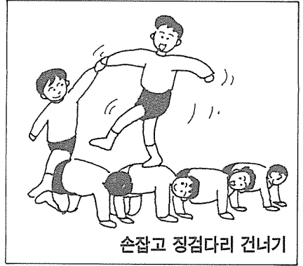
손잡고 징검다리 건너기