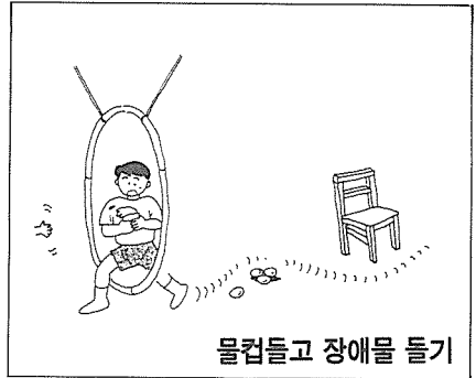
물컵 들고 장애물 돌기