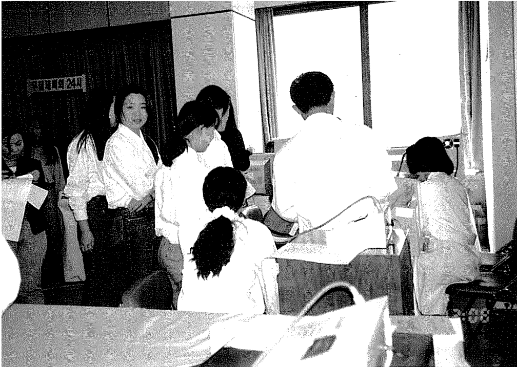
▲ 건협 인천지부는 지난 9월 28일, 대한영양사회의 자체 행사에 참가해, 회원들을 대상으로 혈압·혈당·비만도 측정 및 건강상담 등을 실시했다.