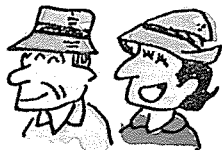
• 치료적 레크리에이션