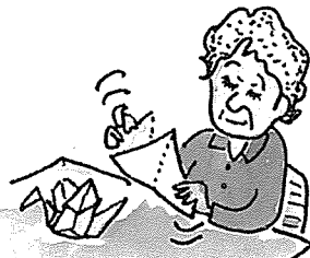
종이접기, 글씨쓰기, 꽃꽂이, 공작 등