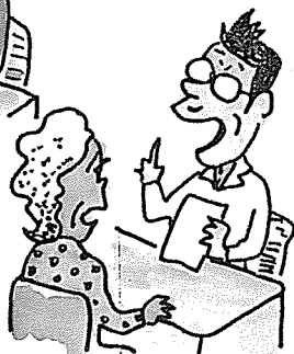
• 언어요법 언어장해의 극복 말·읽기·쓰기·구음 등의 장해, 말 실수