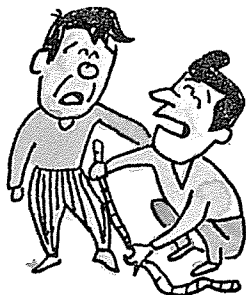
• 장비제작 기술 손발의 기능을 보다 좋게 하는 기구와 보조물