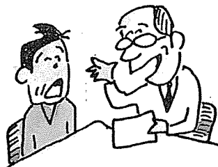
• 심리학과 정신의학 지적, 정서적 기능의 탐구