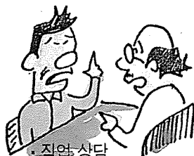
• 직업 상담 직장에서의 복귀