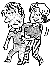
• 사회적 활동 가정과 지역사회의 문제 해결