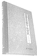
韓國近代醫學教育史

부한 사람들을 ‘국내유학’이 아닌 ‘해외유학’ <제9편 醫學界의 海外留學生>이라고 지칭한 것을 민족적 견지에서 이해를 구한 점과 머리말 말미에 ‘광복 50돌날’이라는 문구는 奇박사의 學者로서의 愛國心을 읽을 수 있다.