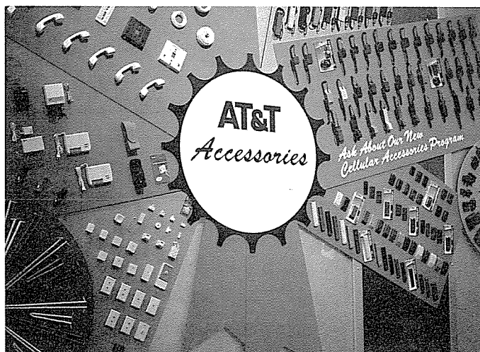
▲AT&T의 각종 이동통신기기

「CASIO IP-800」이라 명명된 Word sender는 앞으로 종합정보통신을 지향하는 미래 통신산업에서 전화기가 음성정보 기능을 보내는 수준을 뚝