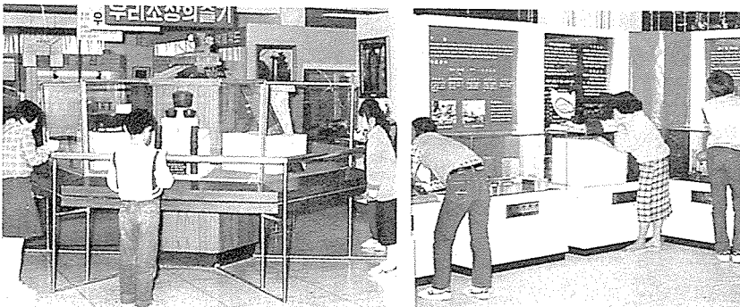
◇우리조상의 발명품 및 최신과학·표준원기 등이 설치돼 있는 과학전시관 관람 모습

이밖의 문의사항은 경기도과학교육원(수원 전화 (0331)45-4141~5)으로 연락하면 알 수 있다. 67