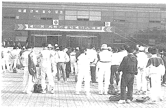
▲제15회 과학기술인테니스대회 개최식장면

또한 2천년대 소프트웨어 위주의 정보화시대에 대비한 국가프로젝트의 일환으로 시작된 STEP2000의 CG/VR분야 연구개발 프로그램은 지난해 연구가 진행되어 CG/VR 관련분야의 기업체들로 구성된 한국첨단영상연구조합과 시스템공학연구소, 한국과학기술