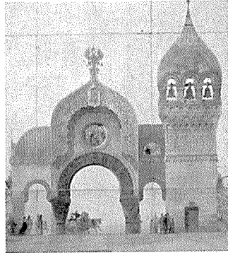
키에프 시의 문, 정면