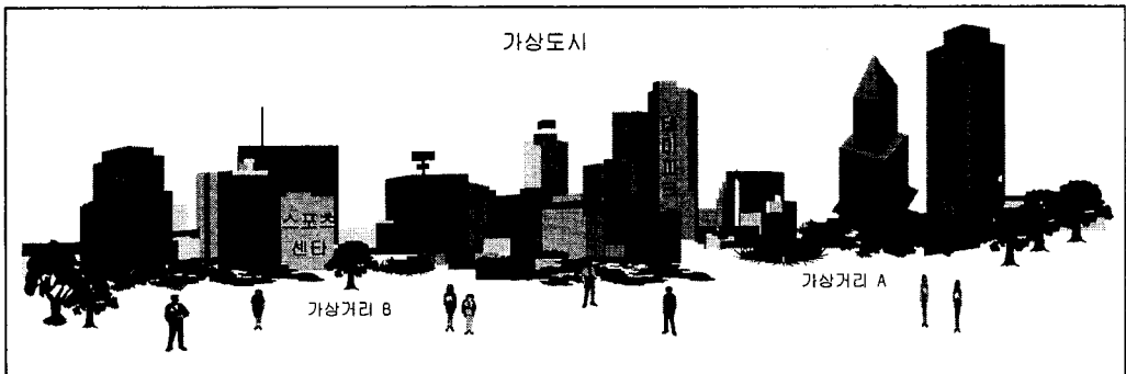
〈그림 1〉 가상사회에서의 가상도시 예.

여기서 ‘가상사회’의 개념은 실세계의 사회적 기능을 은유(Metaphor)하여 가상공간의 임의의 범위에 집약화하므로써 실세계의 인간의 사회 활동을 지원하고자하는 것이다. 이러한 가상사회는 실세계와 마찬가지로 여러개의 가상도시(Virtual City)가 존재하고 가상 도시내에는 가상거리(Virtual Street)가 존재한다(그림 1. 참조). 그리고 가상거리 주변에는 실세계에서 제공되는 다양한 사회적인 기능들이 존재한다. 가상공간에서 수행 가능한 대표적인 가상사회의 사회적 기능으로는 쇼핑센터, 박물관, 영화관, 교육 기관, 테마파크, 스포츠 센터, 교통 터미널, Adventure shop, amusment center 등을 들 수 있다. 이러한 사회적 기능은 실세계에서와 같이 가상도시에서도 공간적으로 배치되어, 사용자는 그 가상도시에 몰입하여 사회적인 활동을 할 수 있다. 이와 같은 가상 사회는 인터넷상에 여러개의 가상도시들로 구현된다. 가상도시는 정보 제공자에 의해서 구축된다. 그리고 지구촌 어느곳에서든 누구나도 가상도시에 가서 사회적 기능을 제공받는다(그림 2.는 사회적 기능중 가상 교육 개념도를 나타낸다).